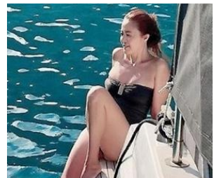
50세 맞아? 완벽 비키니 몸매 자랑