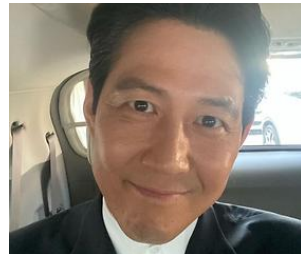
'오징어 게임' 이정재 SNS 팔로워가..