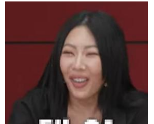
제시 "가방엔 생리대...오늘이 그날이라.." 발언