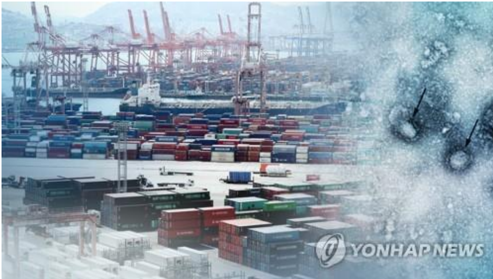
하루평균 수출 14개월 만에 반등...변수는 '코로나' (CG)

(서울=연합뉴스) 고은지 기자 = 신종 코로나바이러스 감염증(신종코로나)이 계속 확산하면서 반등을 눈앞에 둔 한국 수출의 발목을 잡을지 우려가 커지고 있다.