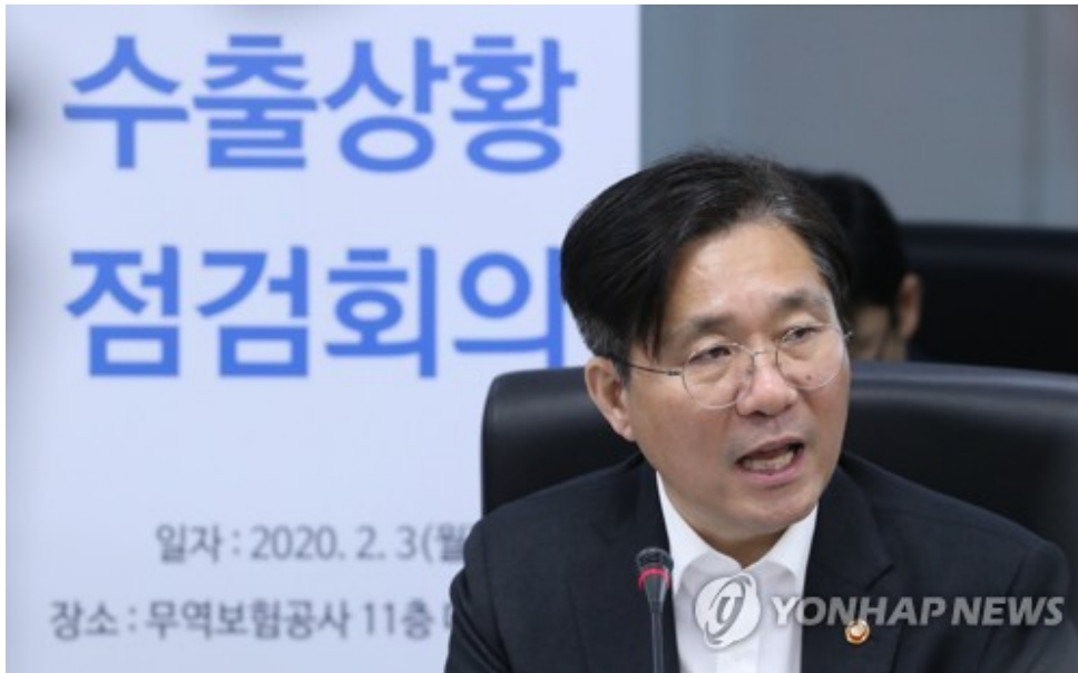
성윤모 장관, 신종코로나 대응 수출상황 점검 성윤모 산업통상자원부 장관이 3일 종로구 한국무역보험공사에서 신종코로나 대응 대중국 수출입 현황 점검회의를 하고 있다. 2020.2.3

이는 당시 대중 수출기업 127개 중 조사 시점까지 수출 차질이 발생한 67개 업체(차질액 1억9천 800만달러)의 대중 수출 비중(44.3%)을 고려해 환산한 수치다.